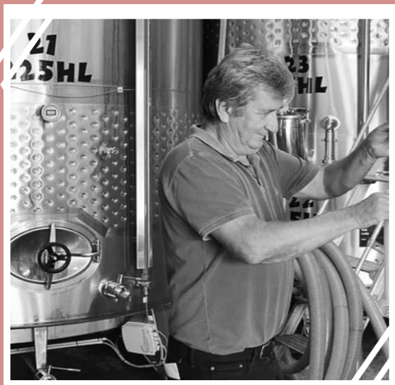
DOMAINE SAINTE LUCIE MICHEL FABRE